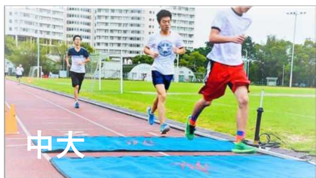
田徑場地氈天線 (大學)