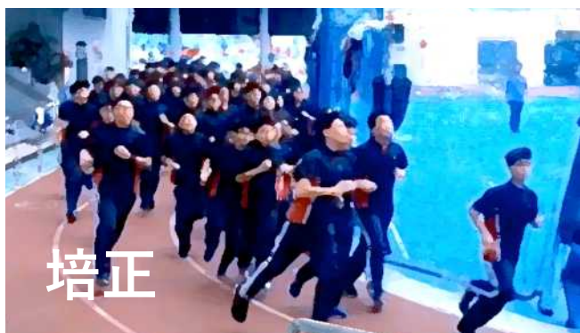
操場 9 分鐘跑 > https://youtu.be/vWGz1X40ohQ