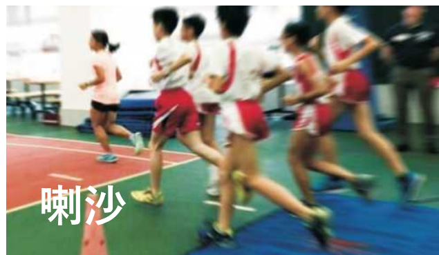
雨天有蓋操場地氈天線