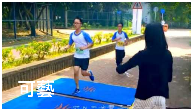
戶外環河跑 > https://youtu.be/f4EjStwTKiM