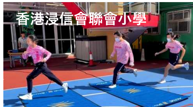
小學雙籃球場 9 分鐘跑 > https://youtu.be/RdOEzB8z-Qw