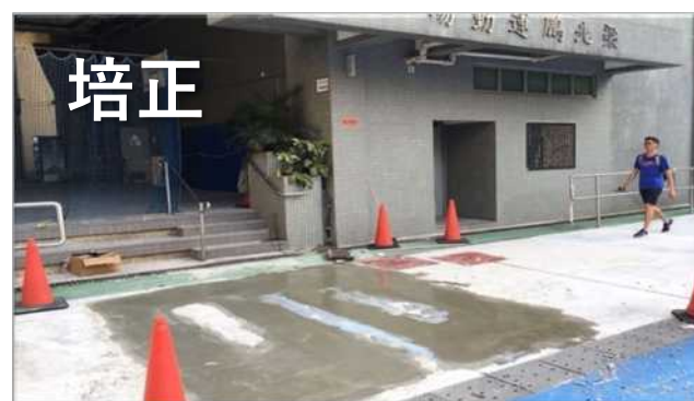
隱藏式地底天線(泰坦跑道地底)