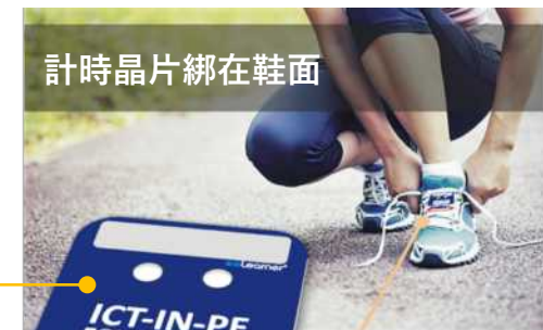
計時晶片綁在鞋面