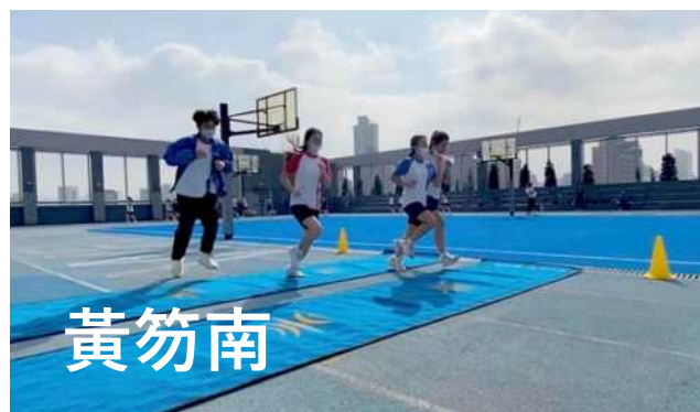
天台限圈跑 > https://tinyurl.com/mrs4ky88