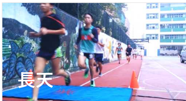
長天傳統 25 圈長跑 (7Km)